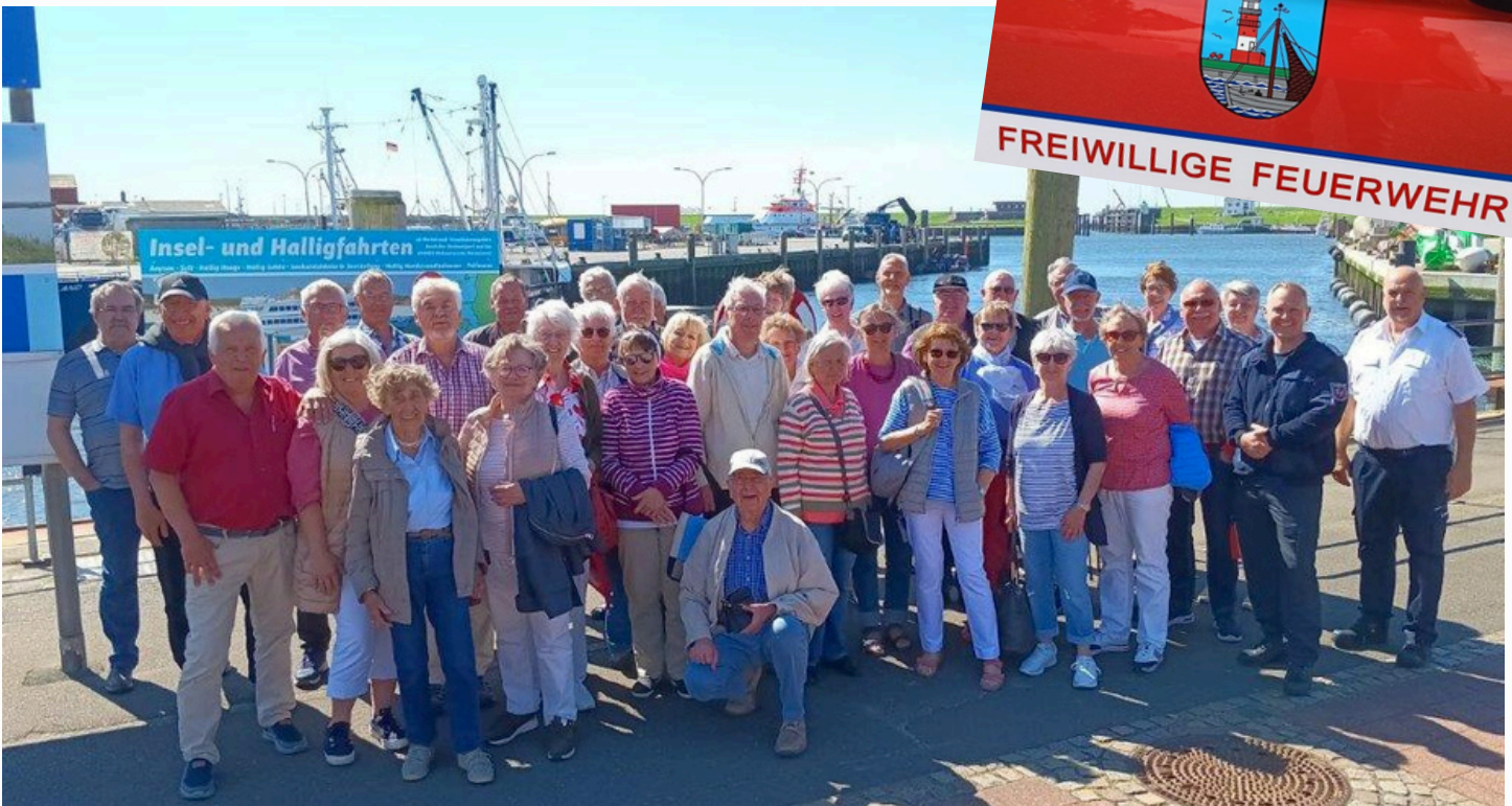
Die „Ehemaligen“ des Landesfeuerwehrverbandes bei ihrem Ausflug in Büsum.

Den Abschluss eines sonnenverwöhnten Tages bildete die gemeinsame Kaffeetafel im Schulungsraum der FF Büsum.