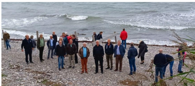
Die „Ehemaligen“ auf Fehmarn.

Das Projekt bot für die Gemeinschaft der Ehemaligen des Landesfeuerwehrverbandes Schleswig-Holstein den Anlass, sich Nordeuropas größtes Infrastrukturprojekt einmal aus der Nähe anzusehen. Die Freiwillige Feuerwehr Burg auf Fehmarn hatte ein sehr interessantes Programm für die Gäste ausgearbeitet. Dazu zählten beispielsweise Ausführungen seitens der Feuerwehr-Führungskräfte über die, zum normalen Einsatzgeschehen hinaus, ehrenamtlich und zahlreich zu leistenden Gesprächseinheiten bezüglich der Sicherheit und des Notfallmanagements. Im Aufbau befindet sich eine hauptamtlich besetzte Feuerwehreinheit.