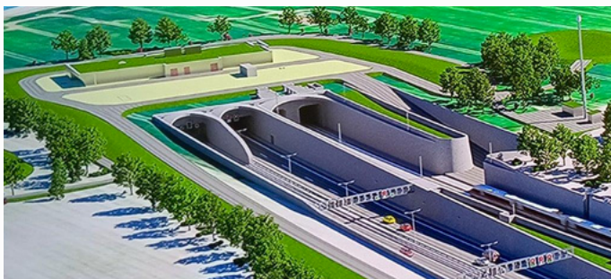
So soll der Tunnel aussehen. Grafik: A/S Fehmarn

Der Bau des Ostseetunnels zwischen Deutschland und Dänemark schreitet unaufhörlich voran. Die Baustelle des Tunnels der zukünftigen Festen Fehmarnbeltquerung ist ein deutsch-dänisches und für den gesamten europäischen Wirtschaftsraum wichtiges Infrastruktur-Projekt. Sehr interessante, detaillierte Vorträge gab es für die Feuerwehr-Gäste im Informationszentrum in Burg auf Fehmarn sowie auf den Baustellen.