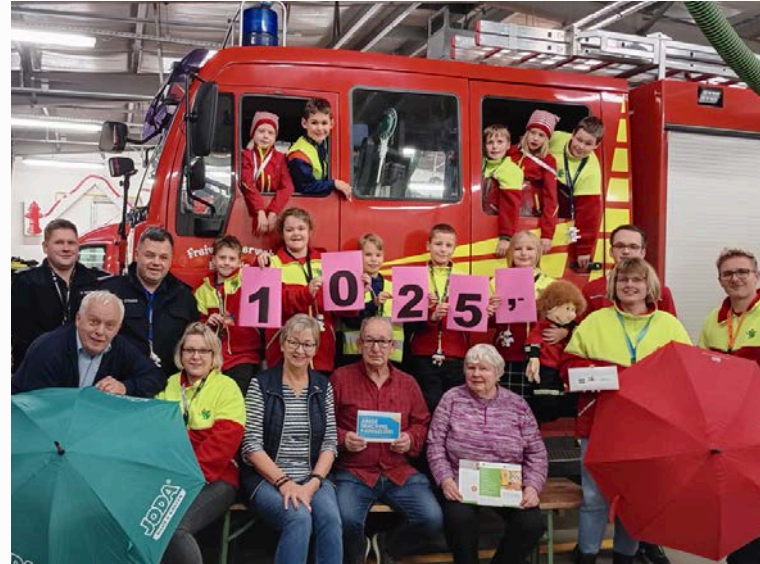
Abordnungen der Kinderfeuerwehre und der Vorstand der Günnbeker Plattsacker bei der Übergabe des Erlöses aus der Aktion „112 Regenschirme“.

Die 112 Schirme, dazu jeweils einige Kleinpreise, wurden auf den unterschiedlichsten Veranstaltungen der Feuerwehr oder bei privaten Festen versteigert oder verlost. Für diese Aktion stellten zahlreiche Firmen, Versicherungen, Banken, die Landesverkehrswacht Schleswig-Holstein und der Landesfeuerwehrverband Schleswig-Holstein Regenschirme mit Werbeaufdruck zur Verfügung.