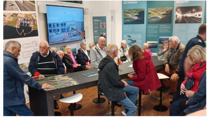
Im Informationszentrum gab es viel Interessantes über die Fehmarnbeltquerung zu erfahren.

Das Projekt bot für die Gemeinschaft der Ehemaligen des Landesfeuerwehrverbandes Schleswig-Holstein den Anlass, sich Nordeuropas größtes Infrastrukturprojekt einmal aus der Nähe anzusehen. Die Freiwillige Feuerwehr Burg auf Fehmarn hatte ein sehr interessantes Programm für die Gäste ausgearbeitet. Dazu zählten beispielsweise Ausführungen seitens der Feuerwehr-Führungskräfte über die, zum normalen Einsatzgeschehen hinaus, ehrenamtlich und zahlreich zu leistenden Gesprächseinheiten bezüglich der Sicherheit und des Notfallmanagements. Im Aufbau befindet sich eine hauptamtlich besetzte Feuerwehreinheit.