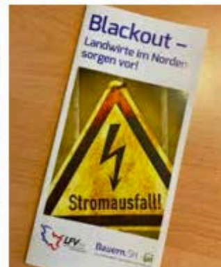
Den Flyer zur Blackout-Vorsorge gibt es in den Kreisgeschäftsstellen des BVSH und im Netz.

bes. Bei örtlich begrenzten Notfällen kann die Feuerwehr helfen, indem sie eine Zeit lang ein Stromaggregat bereitstellt oder beim Sicherstellen der Wasserversorgung unterstützt. Das THW kann helfen, indem es etwa mobile Pumpen oder andere Geräte zur Verfügung stellt, um die Versorgung der Tiere zu sichern. „Die Kapazitäten reichen aber nicht aus, um alle betrieblichen Systeme weiterzube-